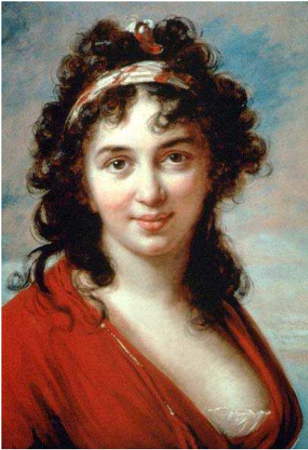
Elisabeth Vigée-Le Brun, Ritratto di Isabella Teotochi Albrizzi.