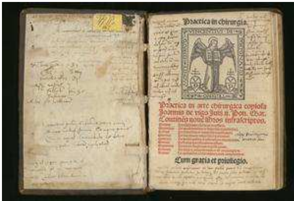
G. Da Vigo, “Practica in chirurgia” (1514)