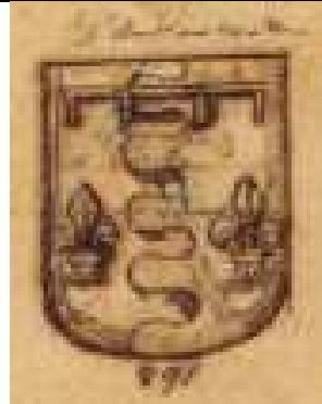
D'Andrea Matteo (1502): Partito innestato: nel primo di ..., a un giglio di ...; nel secondo di ..., a un giglio di ..., al lambello a quattro pendenti di ..., posto in capo, attraversante sulla partizione 1 .