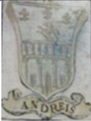
Andreis, in "Armoriale delle famiglie italiane" (fine sec. XVI).