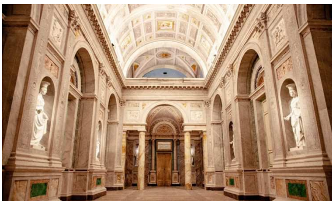
Salone di palazzo Bruschi Falgari