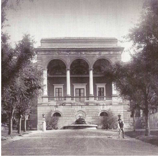
Villa Bruschi Falgari (c.1860)