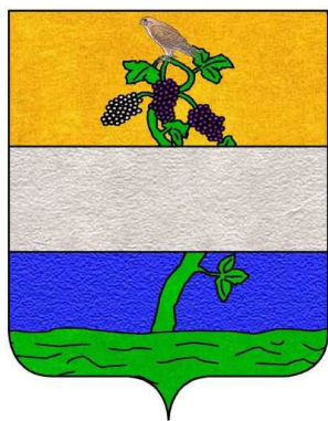
Stemma Bruschi Falgari

Filmato “Speciale su villa Bruschi Falgari”: https://www.youtube.com/watch?v=OXPEeayRm1c